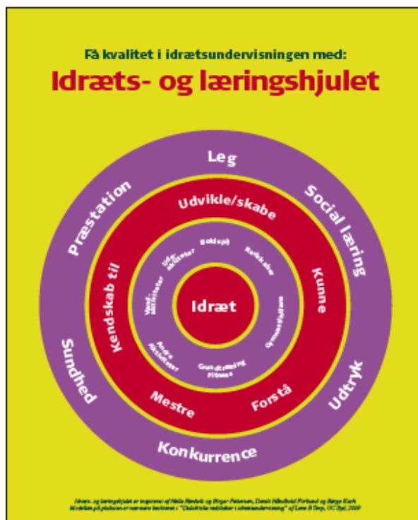
Figur 1: Idræts- og læringshjulet , af SKUD (skoleidrættens udviklingscenter)

Modellen bekræfter således at social læring har en vigtig position i idrætsfaget, og den kan benyttes til at skabe et overblik i lærerens praksis, især med henblik på de didaktiske overvejelser. Ligeledes kan modellen inddrages i selve undervisningen, for at give eleverne bevidsthed om lektionernes indhold og mål. Denne indsigt hos eleverne, vil jeg også bringe på banen senere i min proces.